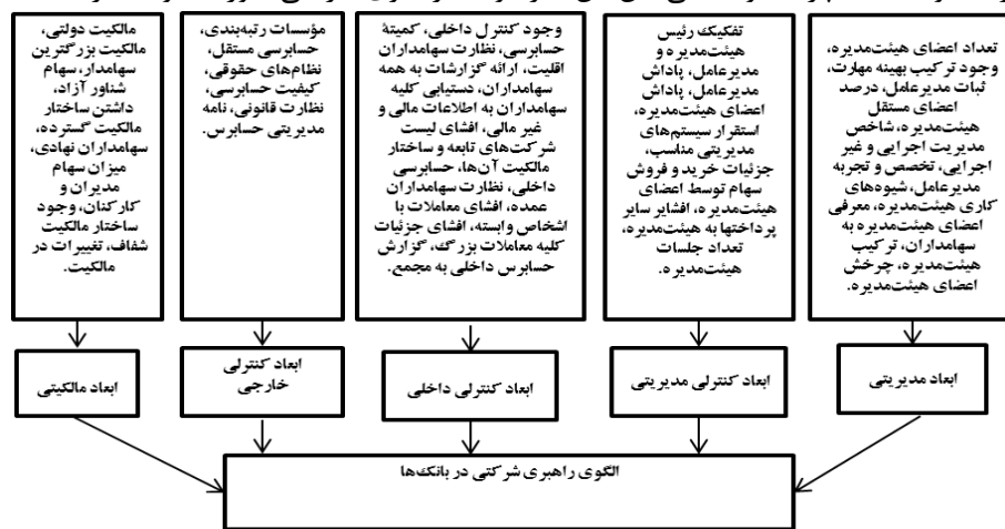
شکل (۱): الگوی مفهومی پژوهش (محقق ساخته)

نظام راهبری شرکتی یک ابزار نظارتی است که در شرکت‌ها، بخصوص مؤسسات مالی، به منظور نظارت بر فعالیت‌ها و در جهت دستیابی به اهدافی نظیر پاسخگویی، شفافیت، عدالت و رعایت حقوق ذینفعان به کار می‌رود. الگوی مفهومی شکل شماره (۱) نشان‌دهنده اهمیت الگوی راهبری شرکتی است که برای بانک‌ها ارائه خواهد شد. ارتباط مستقیم و غیرمستقیمی که بین اجزای شرکت با ساختار راهبری شرکتی وجود دارد نشان از اهمیت الگویی خواهد داشت که ارائه خواهد شد، چرا که وابستگی بین این اجزا توسط راهبری شرکتی صورت خواهد گرفت.